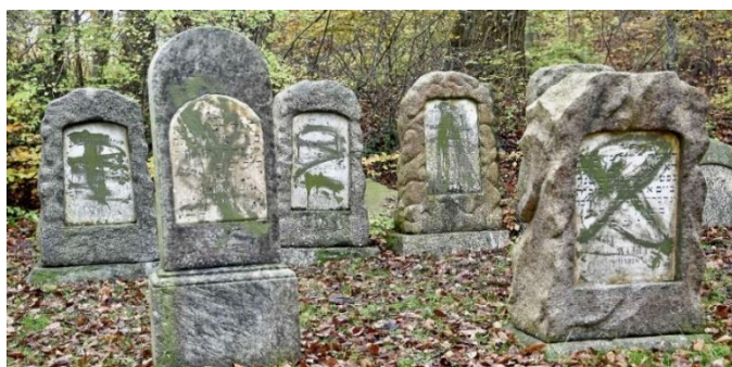
Gravskænderiet på den jødiske kirkegård.

Antisemitismen blev i denne debat hevet ud af den racistiske ramme på trods af, at anledningen til debatten var hærværket på jødiske gravsteder og chikane af jøder på årsdagen på Krystalnatten den 9. november 2019. To nazister fra NMR Nordisk Modstandsbevægelse stod bag og er dømt for gerningerne. Det er helt absurd, at store dele af diskussionen handlede om indvandrere, muslimer og udlændingepolitik. Racistiske argumenter for at bekæmpe antisemitismen!