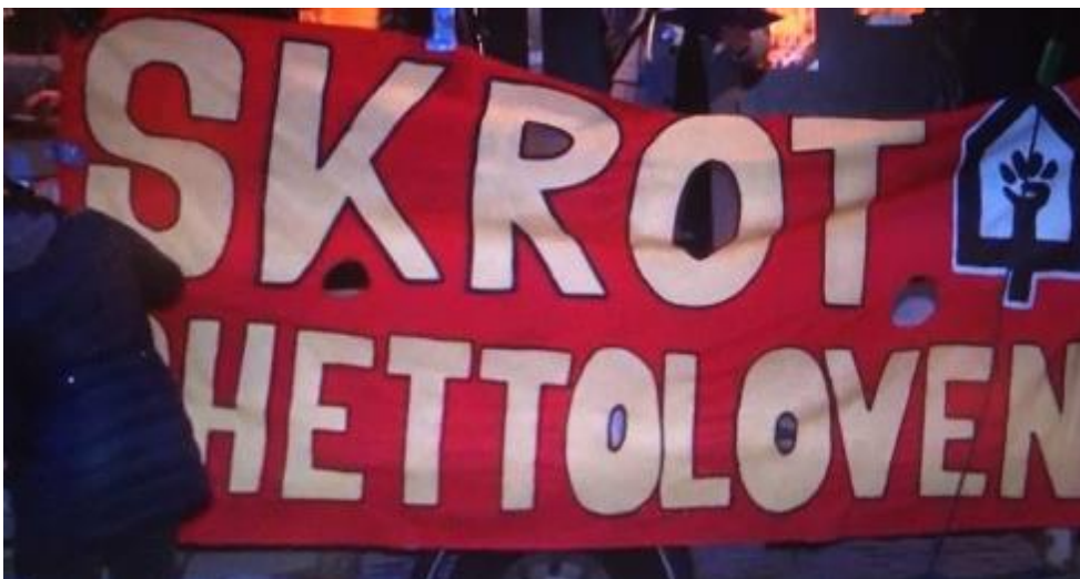
Banner fra demonstration mod ghettolisterne d. 5. december 2020

Denne "integrationspolitik" kræver i sidste ende total assimilering for at opnå ligebehandling, men den konstruerer kun endnu større ulighed.