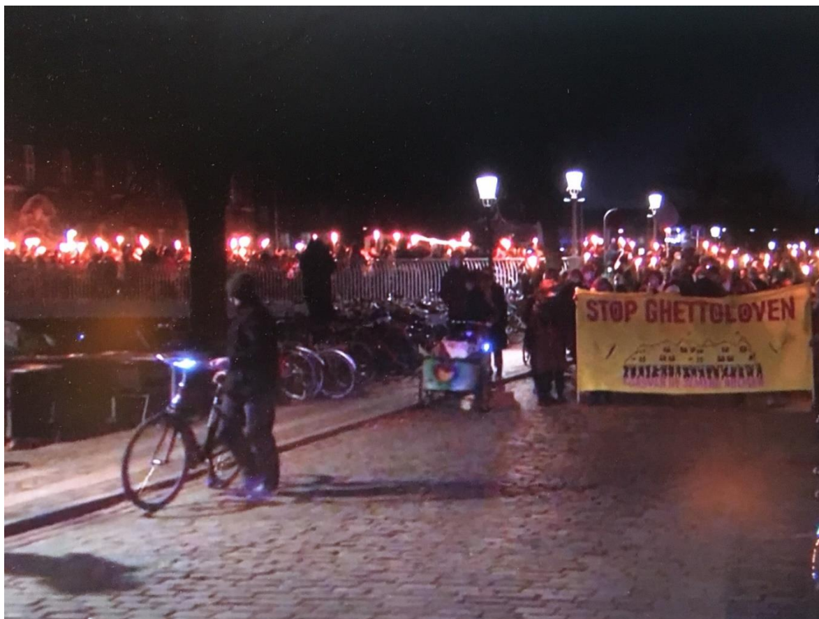
Stop GhettoLOVEN og afskaf ghettolisterne

Bekæmp racismen – Almen modstand havde indkaldt til demonstration d. 5 december